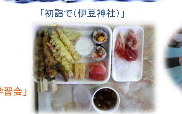
「お取り寄せバイキング」