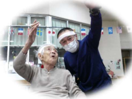
「赤組、白組がんばれー」