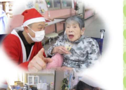
「クリスマス忘年会」