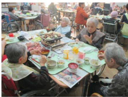
クリスマスに焼肉！