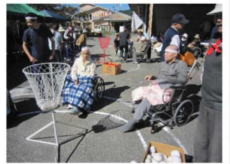
運動会で玉入れ競争