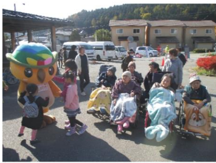
売木村秋色感謝祭へ