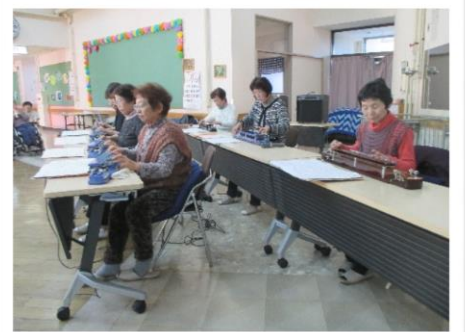
大正琴コンサート